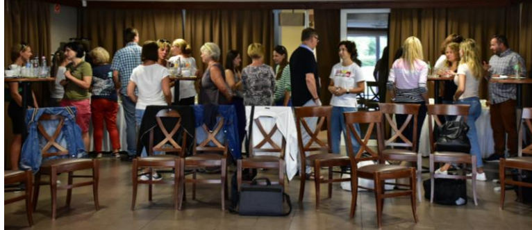
Workshop, szakmai nap